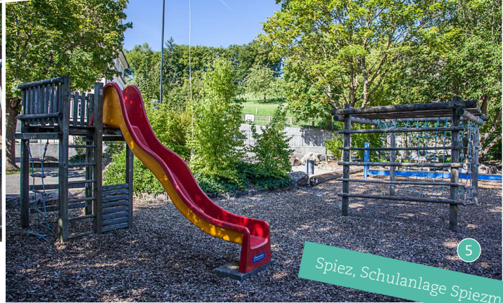
Spiez, Schulanlage Spiezmoos