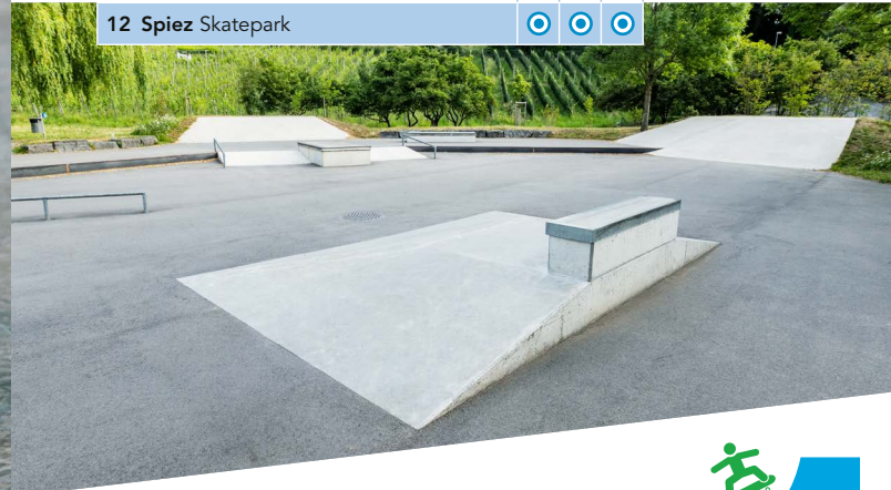
12 Spiez Skatepark