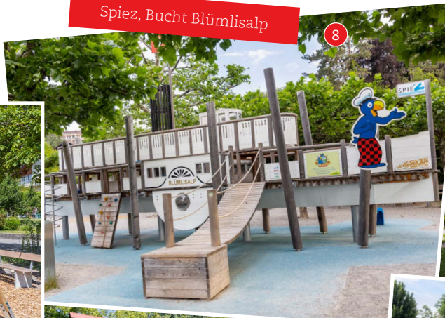
Spiez, Bucht Blümlisalp