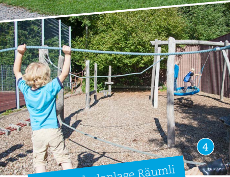
Spiez, Schulanlage Räumli