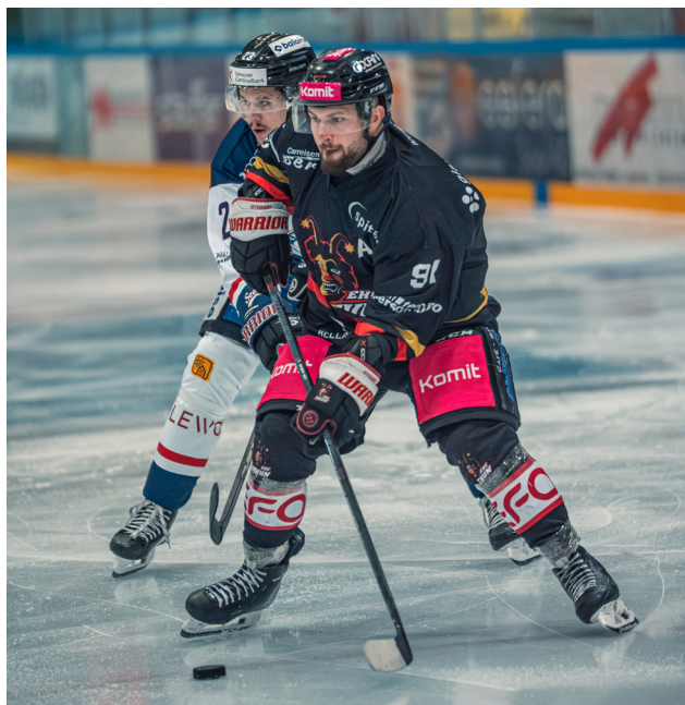
EHC Thun im Einsatz

Eishockeyfans aufgepasst: Der Eishockeyclub Thun lädt Spiezer Einwohner zum aufregenden Heimspiel gegen den EHC Wetzikon ein.