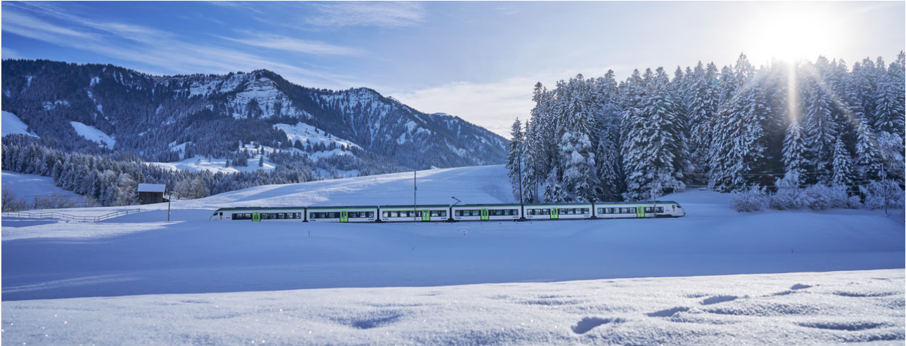
BLS-Zug mit schöner Aussicht in Spiez.

Einen Tag lang in der Schweiz unbeschränkt Bus, Postauto, Tram, Zug und Schiff fahren: Die Spartageskarte Gemeinde macht es möglich.