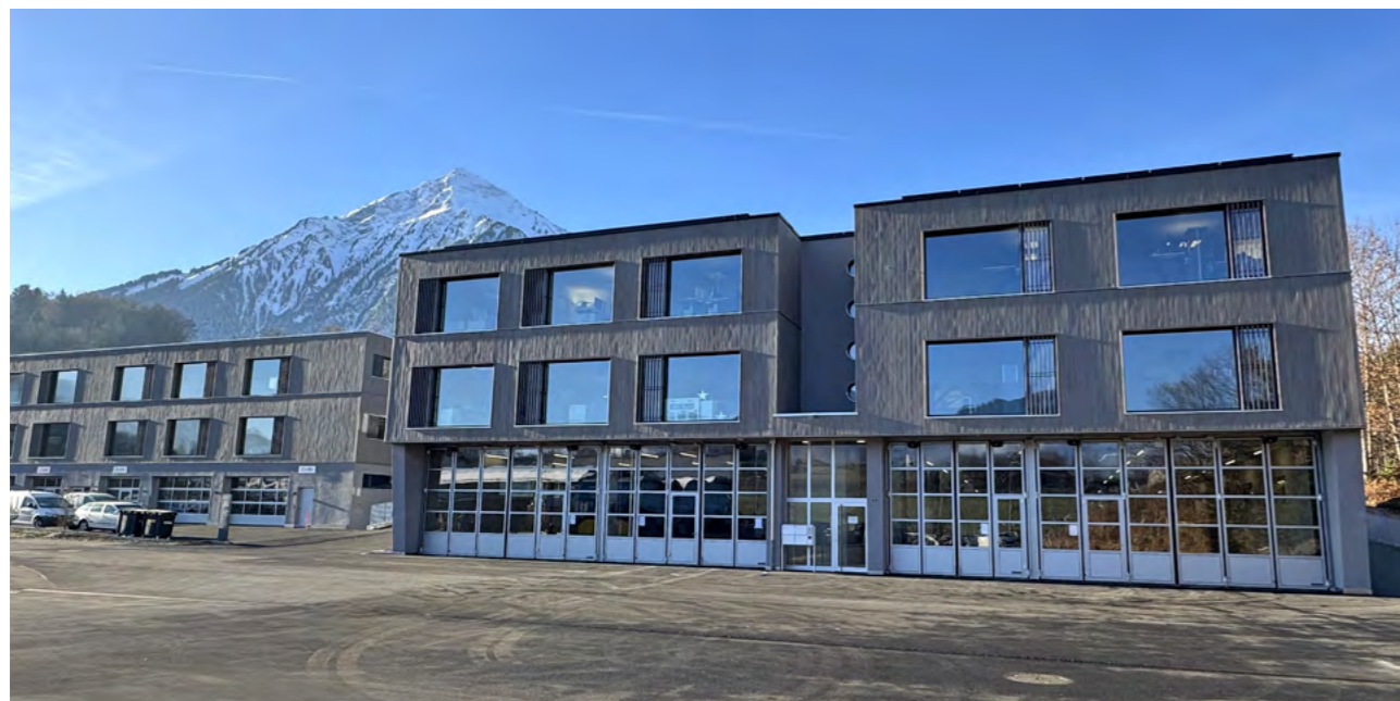
Der Gewerbepark Angolder: verschiedene KMU aus ganz unterschiedlichen Branchen vereint an einem zentralen Standort. Gebäude 1 im Vordergrund, Gebäude 2 links im Hintergrund.

Wo früher freie Fläche war, ist heute ein Ort voller Ideen, Arbeitsplätze und architektonischer Qualität entstanden.