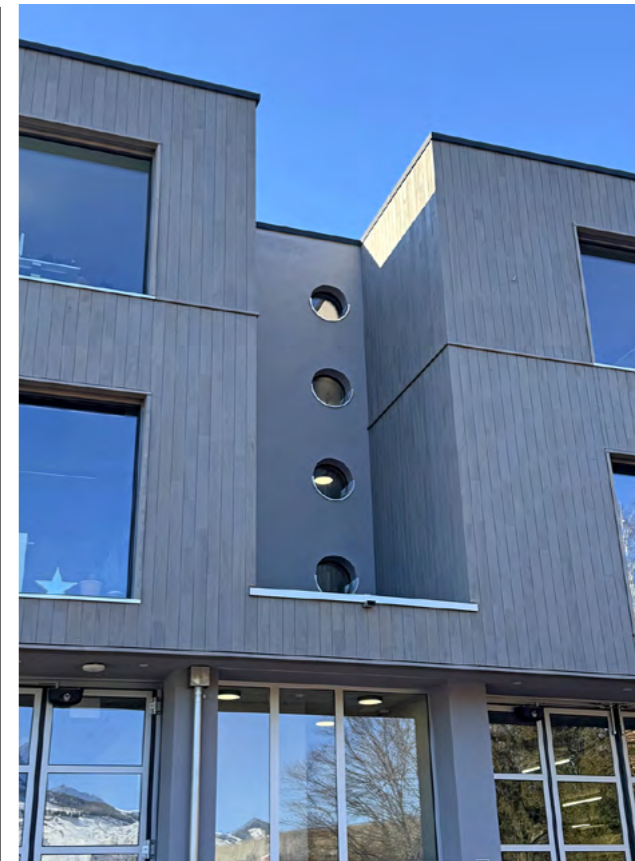
Die Fassadenzäsur teilt das Gebäude optisch auf und lässt es trotz der grossen Volumen leicht erscheinen.

«Natürlich haben wir uns auch Gedanken zu einer dritten Bauetappe gemacht und unsere Architekten haben dazu schon Überbauungsvarianten entworfen. Aber das ist noch nicht spruchreif. Im Moment liegt unser Fokus klar auf der zweiten Bauetappe: Erst wenn diese umgesetzt ist, schauen wir weiter.»