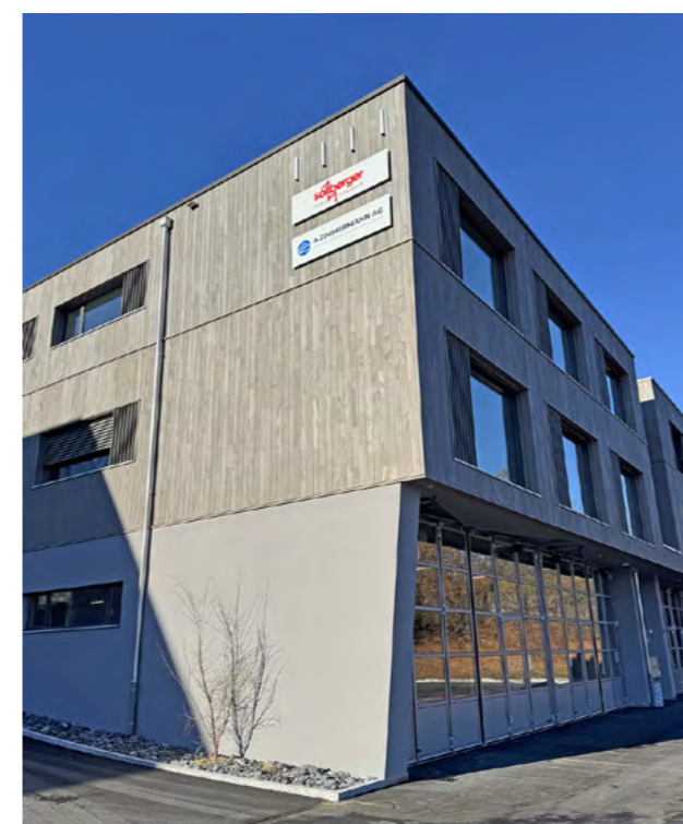
Gebäude 1 von der Seite: moderne Materialien fügen sich harmonisch in die Landschaft ein und spiegeln den nachhaltigen Ansatz des Gewerbeparks Angolder wider.

«Uns war wichtig, keinen klassischen Industrie- oder Hallenbau zu realisieren, sondern ein Gebäude, das sich in die Landschaft einfügt. Deshalb kam früh das Thema Holz auf, als nachhaltiges Material, aber auch um die grossen Volumen optisch zu beruhigen. Uns war bewusst, dass die Gebäude von weit her sichtbar sind, darum haben wir mit Erdtönen und einer zurückhaltenden Fassadengestaltung gearbeitet. Durch bewusste Zäsuren, etwa beim Erschliessungskern, wirken die Baukörper lockerer und nicht wie ein durchgehender Riegel. Konstruktiv ist es ein moderner Hybridbau: Dort, wo es statisch nötig ist, kommt Stahlbeton zum Einsatz, und wo möglich haben wir bewusst mit Holz gearbeitet.»