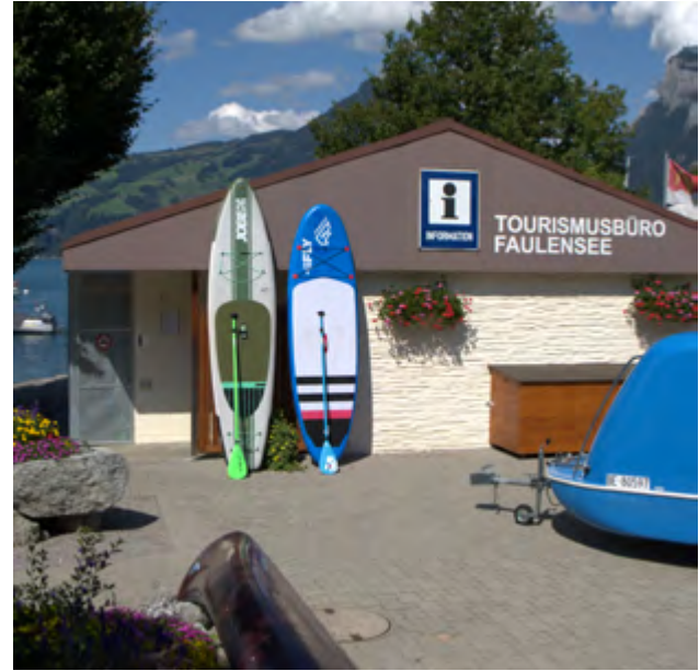
Das Tourisusbüro in Faulensee (links) und der Info-Point in der Spiezer Bucht (rechts).