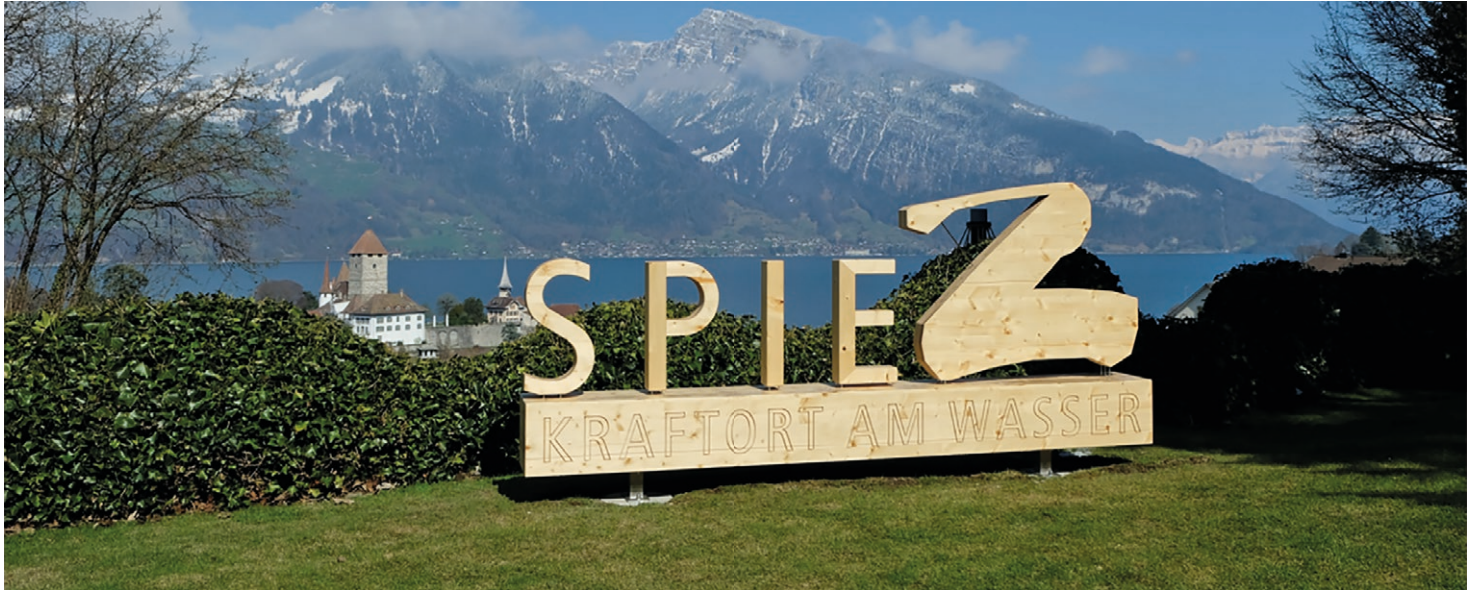
Der Spiez-Schriftzug im Schonegg-Park und die Grand Tour Stele auf der Bahnhofplattform sind Teil der neuen Fotospot-Tour.

Spiez baut sein virtuelles Erlebnisangebot aus. Eine Fotospot Tour zu den schönsten Plätzen von Spiez, ein Sagenrundgang und eine Kirchentour.