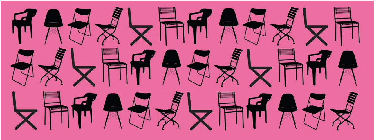
Usestuehle - Der Gewerbe-Event, an welchem sich Spiezer Gewerbetreibende vor der Laden- bzw. Bürotüre auf eine kreative Art und Weise vorstellen.

Präsentieren Sie am Erlebnisevent Usestuehle vom 20. August 2022, 10.00 – 16.00 Uhr, Ihren Betrieb vor der Laden- bzw. Bürotüre.