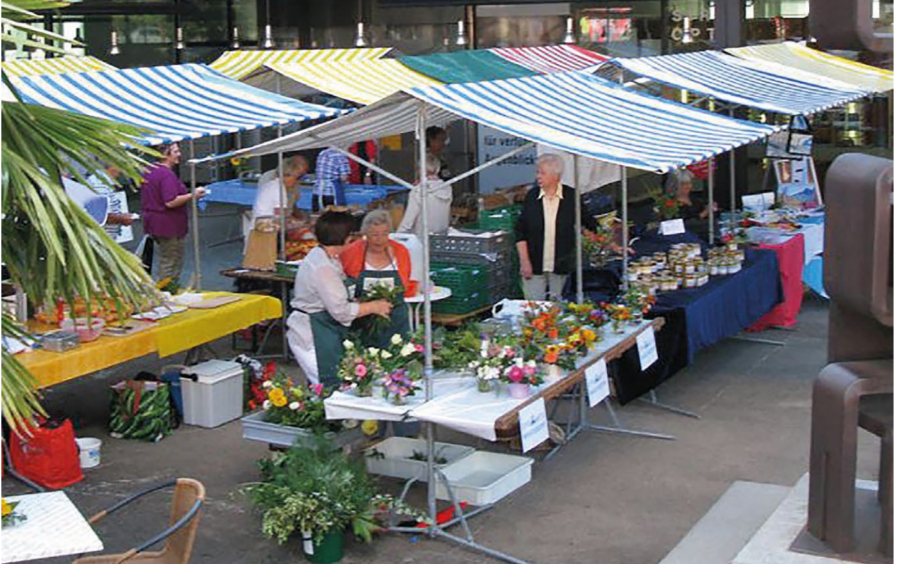
Kronenplatz Märkt - Regionale Einkaufsmöglichkeit und Treffpunkt zugleich.

Frühlingsmärkt - Samstag, 7. Mai 2022 von 8.30 bis 13.00 Uhr