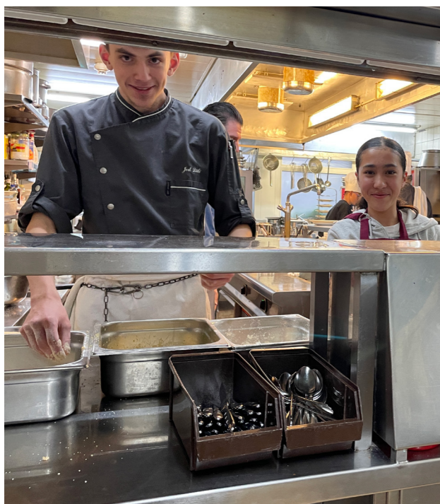
Mansha am Küchenpass

Eine 8. Klasse aus Spiez half während zwei Tagen im Restaurant Seegarten-Marina mit – auf Anfrage von Gastro Bern. Dabei lief nicht alles nach Plan. Aber das Interesse war geweckt: Der Betrieb erhielt danach mehrere Anfragen für Schnupper- und Wochenplätze.