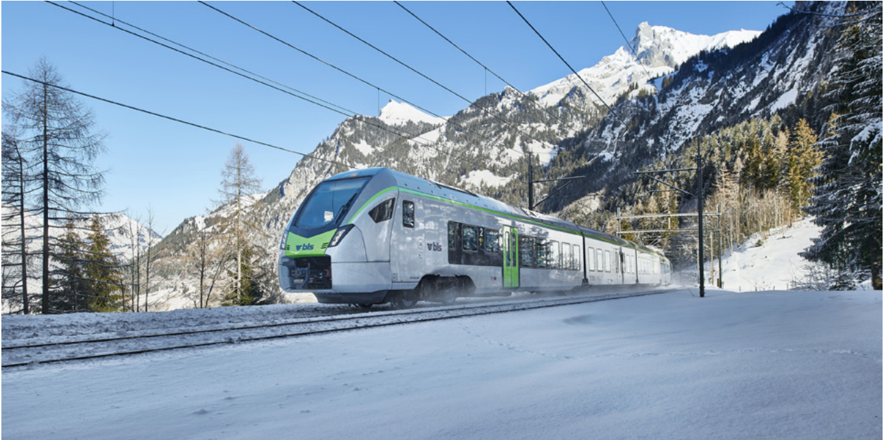
BLS-Zug braust durchs Kandertal

Die beliebte Gemeinde Tageskarte wird per 31.12.2023 durch die neue SBB- Spartageskarte Gemeinde abgelöst. Das neue Produkt kann ab sofort im Info-Center Spiez bezogen werden und bietet attraktive Neuerungen.