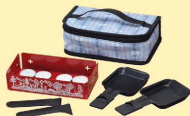
2er Raclette Fr. 29.90 statt Fr. 39.90