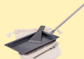
Outdoor Raclette Kit Fr. 19.90