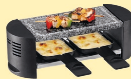
2er Raclette Fr. 23.- statt Fr. 39.-