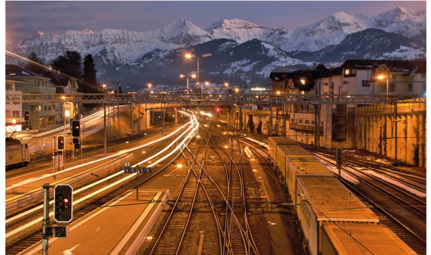
Der Bahnhof Spiez hat hervorragende Verbindungen in die ganze Schweiz.

Einen Tag lang unbeschränkt Zug, Schiff und Bus fahren: Die beliebten Tageskarten machen dies für 50 Franken möglich!