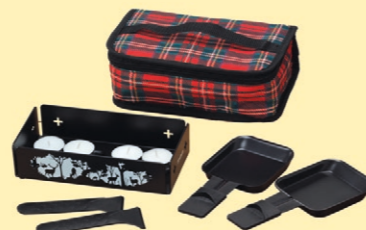
2er Raclette Fr. 29.90 statt Fr. 39.90