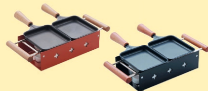
2er Raclette TTM Fr. 58.-