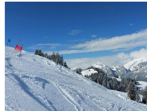
Die «Heimatbasis» vom Skiclub Faulensee ist das Skigebiet Elsigenalp.

Portrait Verein Skiclub Faulensee: «Schnee ist unsere Passion!»