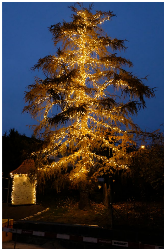
Die beleuchtete Tanne beim Minikreisel an der Seestrasse. Heuer werden nur einzelne Bäume beleuchtet.

Wegen der drohenden Strommangellage wird in Spiez die reduzierte Weihnachtsbeleuchtung vom 1. Advent bis zum Dreikönigstag jeweils von 17 bis 22 Uhr eingeschaltet sein.