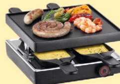
4er Raclette Fr. 59.- statt Fr. 99.-