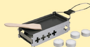
1er Raclette Kisag Fr. 19.90