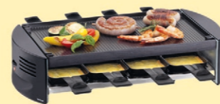
8er Raclette Fr. 89.- statt Fr. 119.-